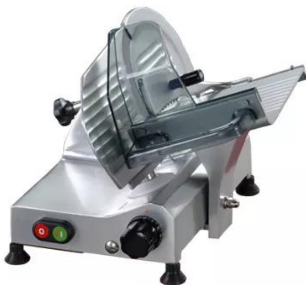
F 195 CE

AFFETTATRICE ELETTRICA A GRAVITA' IN ALLUMINIO lama diam. cm.19,5 CON AFFILATOIO ESTERNO -- normativa SICUREZZA CE USO DOMESTICO --