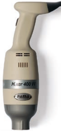
MIXER 400 VV