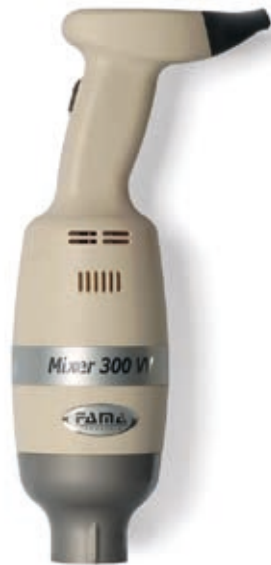
MIXER 300 VV

La tecnologia SRS consente di ottenere composti estremamente omogenei. SRS device grants high-quality homogeneous mixtures.