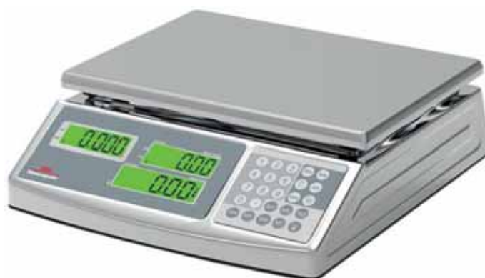
MINNEAPOLIS BPX 40/2

Attenzione! Bilance per solo uso di laboratorio, non sono omologate per la vendita al dettaglio. Warning! Scales for internal use not approved for sale.